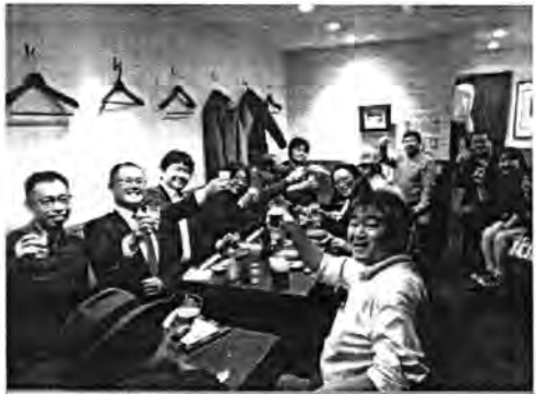
リニューアルオープンで雰囲気も新たに