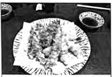
そば屋のそばを撮ってこない失態 天からももちろん美味しい

11月25日(月)40回目となる料飲部主催・北区飲食店交流会を、赤羽の日本そば・明石屋さん(読者)で行いました。明石屋さんは、創業から30年以上営業を続けていますが、このほど創業者の大将から息子さんに経営をバトンタッチ。若大将は自分が修行した腕を振りたいとメニューも一新。お店も改装し、新明石屋としてスタートしました。交流会では、たくさんのお料理やお酒も披露。好きな地酒をどれでも選べるなど、会費以上の大サービス、もちろんお蕎麦も美味しくいただきました。今回は、日本そば屋さんが会場とあり、同じ日本そばの十条支部・彩めさんが研究も兼ねてと臨時休業して参加。同じく上中里の浅野屋さんと3人で、そばの打ち方や寝かし方、出汁のとり方などの情報交換を熱心に行なっていました。端で聞いていた他の参加者が「へえ〜」「そういうこだわりがあるのか〜。」と感嘆するほどの奥の深い話も聞け、同業種の集まりならではの経営交流会となりました。