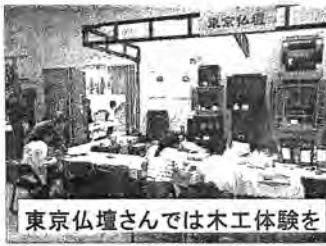
東京仏壇さんでは木工体験を