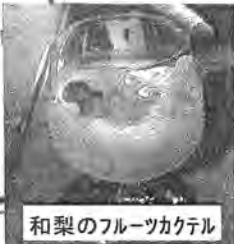
#9さんのイベントメニュー