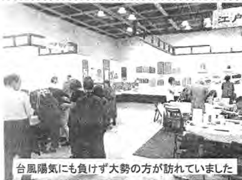
台風陽気にも負けず大勢の方が訪れていました

10月21日(日) 午後1時より 完全予約制 定員6名 参加費:4500円 場所:東十条駅南口徒歩2分 お申込&お問い合わせは民商へ ☎3913-6632