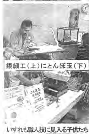
銀細工(上)にとんぼ玉(下)