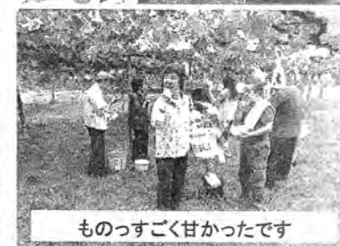
ものつすごく甘かったです