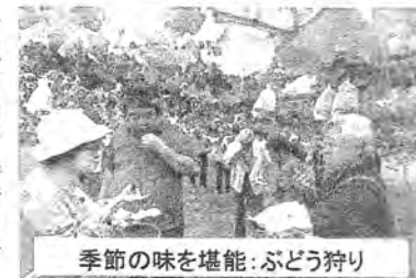
季節の味を堪能:ぶどう狩り