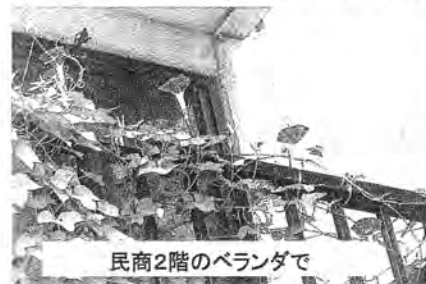
民商2階のベランダで

我が家の同居人が小学校一年生の時に観察していた朝顔。年の終わりに学校から種を持ち帰り、翌年春と一緒に苗を作りました。発芽率が良く、けっこう大勢にお配りして、行き場に困った数株を民商2階のベランダにも植えました。