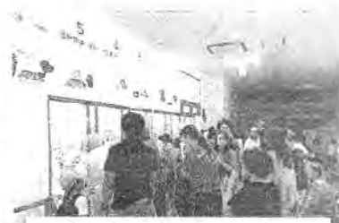
明太パークも人気のスポット