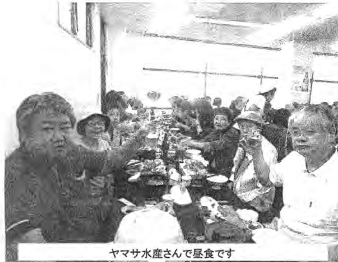
ヤマサ水産さんで昼食です

声変わりもして少し気難しい生き物に変化していますが...朝顔同様、成長を楽しみにしています。そして、平和な世の中を引き継いでやりたいと、心から願っています。