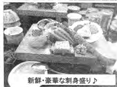
新鮮・豪華な刺身盛り♪