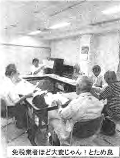
免税業者ほど大変じゃん!とため息

9月1日(土)堀船ふれあい館で北南支部主催の「消費税増税学習会」を開きました。参加は6名。全商連リーフとそれに合わせたレジユメを使って鳥居事務局長が説明しました。今回の10%増税は、一部が8%に据え置かれる複数税率とインボイス(適格請求書方式)が導入されるため、今までの増税とは全く違う状況になります。まず食料品が8%に据え置かれても、包装資材や運送代、水道光熱費が10%になるので、商品そのものが値上がりするので軽減効果は全く期待できません。 その上で食料品を扱っている業者はもちろん、その他すべて業者が接待交際費など経費の部分では10%と8%を区分けした帳簿付けをしなければなりません。スーパーで雑貨や飲料水、お歳暮など一緒に買ったら、領収書から一つ一つ抜き出して10%と8%に分けて整理する。本当に大変です。それ以上に深刻なのはインボイスです。インボイスは消費税額10%と8%を明記した請求書や領収書の事ですが、それを発行できるのは課税業者だけで、免税業者の物は消費税の経費として