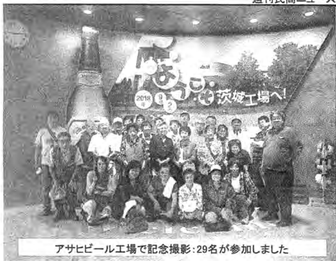
アサヒビール工場で記念撮影:29名が参加しました

来年も参加したい 北区民商共済会のバス旅行は、9月2日(日)、茨城県大洗方面へ盛り沢山の旅に出かけました。王子から高速に乗るころは雨が降り出し、怪しい雲行きになりましたが、アサヒビール守谷工場で朝一番の団体客とな