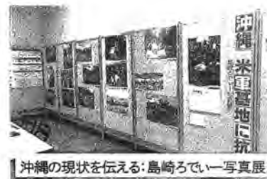
沖縄の現状を伝える：島崎ろでいー写真展

在日米軍の任務は、日本の基地から海外のあらゆる戦場への派兵です。その他にも、日米地位協定という不平等条約の実態が分りやすく描かれていました。