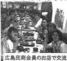
広島民商会員のお店で交流

ら資料館の写真のような体験をしてしまいたかもしれないということです。我々には多くの知識を深め、後世に伝えて行き、原爆の恐ろしさやその後の現状を知り、原爆を無くすことへの一歩となればと思います。