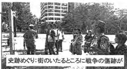
史跡めぐり: 街のいたるところに戦争の傷跡が

加させて頂き、トーマス・ハイノッチ大使(オーストリア欧州統合外務省)、ジエイミー・ウォルシュ大使(アイルランド外務貿易省)、クラウディオ・モンソン大使(駐日キニューバ大使館)など、各国の大使が参加し、核兵器のない平和な世界のために広島に集まっておりました。夕方からは Ringlinkzero に参加させて頂き、日本を含め各国の若者た