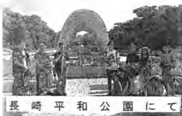
長崎平和公園にて

地震以降福島原発では周囲が放射能に汚染されその数値が分かるモニタリングポストを3000器が復興特別税により維持できているそうです。ですが、復興特別税は2020年で終了となり、2400器が撤去となり不安を感じているそうです。放射能は目に見えず症状も何十年後に出る場合もあるため、今住んでいる地域がどのくらいの放射能の濃度が分からないうちが大変不安なこと知らずのうちに税金を納めることにより被災地域の方々の助けになれたこと、またこうしたことを続けていかなければと思います。またそれ以上に福島原発の被災地域で暮らしていた中学生の現状を聞かせて頂き、寄付金の少なさといじめなど、放射能の間違った知識や自分たちの将来放射能の影響、現状の生活レベルなど語って頂きました。原爆資料館では、今までの方々がなぜ切実に訴えていたか少し納得出来ました。なぜなら一歩間違えていた